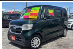
クルマヤ キャッツ