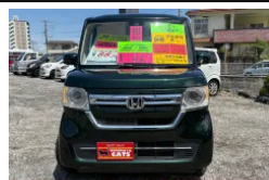
クルマヤ キャッツ